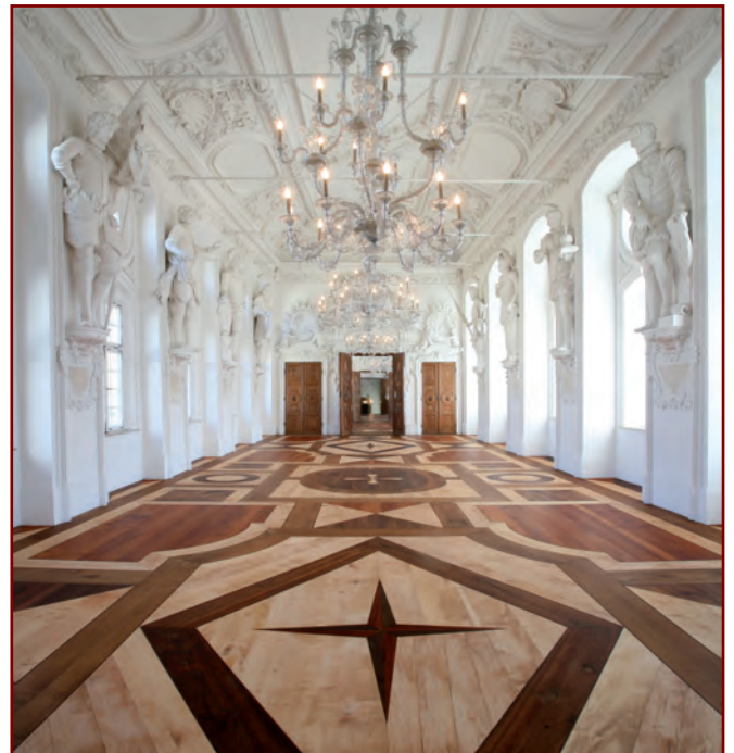
Stuckfiguren und Stuckatur im Preysingsaal Schloss Hohenaschau

So wurde der erst 21 Jahre alte Fontana zum Start seiner Laufbahn mit einer gewaltigen Aufgabe betraut, nämlich der Schaffung der Ahnengalerie im Preysingsaal. In den Jahren von 1681 bis 1683 formte Fontana die 12 überlebensgroßen Stuckfiguren der Preysingschen Ahnen in außergewöhnlicher Schönheit und Ausdruckskraft.