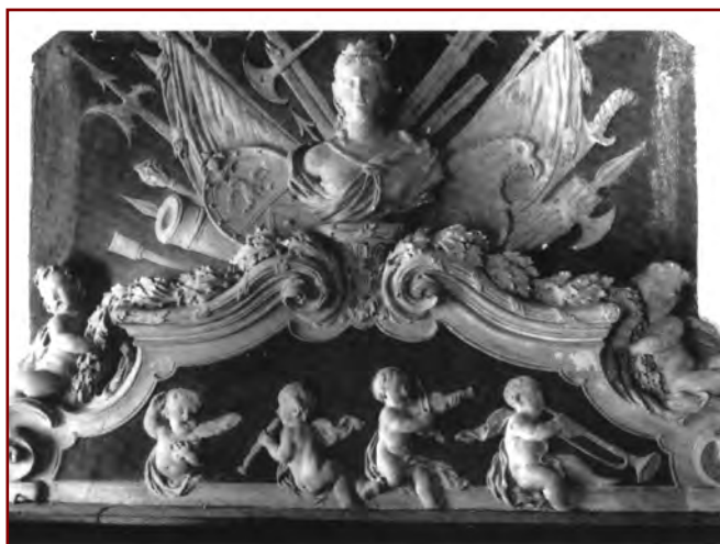
Kaminaufsatz in einem Privathaus

bedeutendstes Hauptwerk, nämlich die Annakirche, die als die schönste Barockkirche Polens gilt.