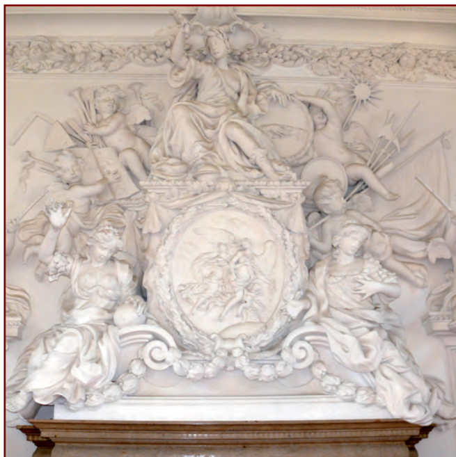
Stuck-Allegorie über dem Ofen im Preysingsaal auf Schloss Hohenaschau

In Mähren hinterließ Fontana in der Umgebung der Stadt Olmütz bedeutende Werke. Von 1695 bis 1704 arbeitete er in Krakau. In dieser Stadt entstand sein