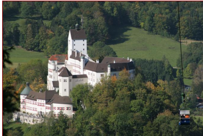
Schloss Hohenaschau, von Südosten