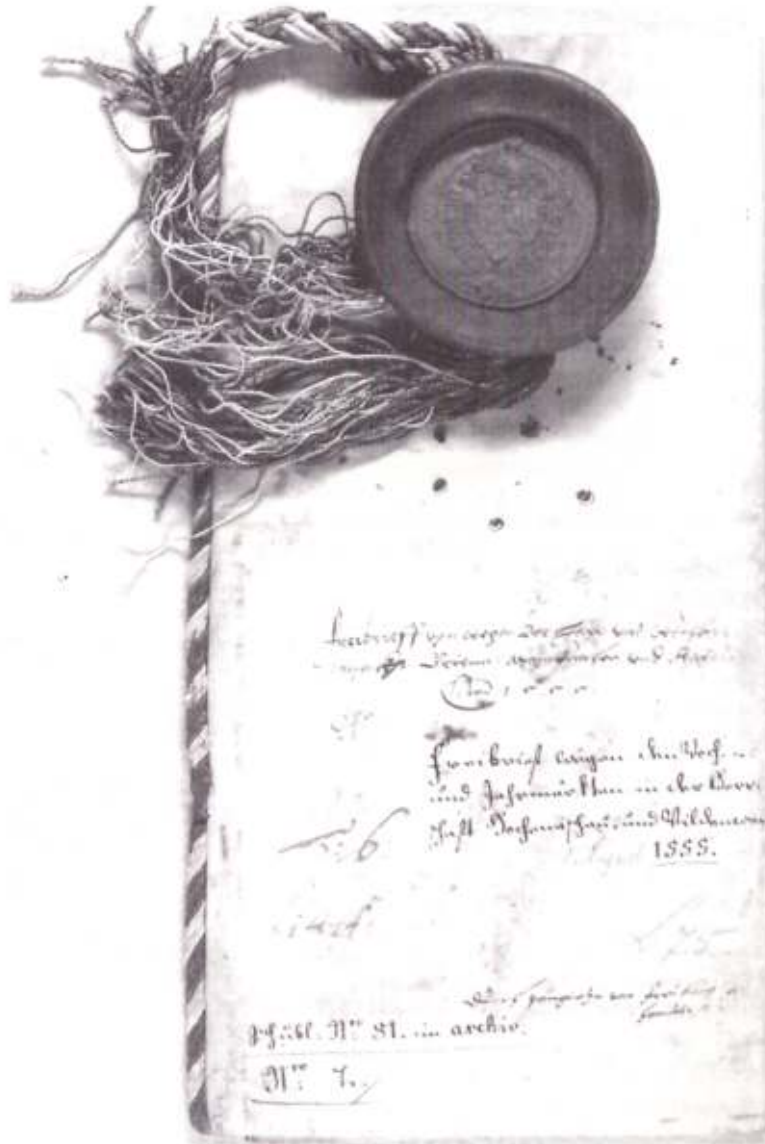
Original - Urkunde von der Verleihung des Marktrechtes durch Herzog Albrecht V. an Pankraz von Freyberg Hohenaschau Staatsarchiv München, Bestand Hohenaschau, A 1393